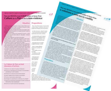
Fiche 1 : Pour une France et une Europe actives en faveur d'une Culture de la Paix et de la non-violence

Afin d'interpeller les candidats, le Mouvement de la Paix a élaboré sous la forme d'un ensemble de fiches, des éléments de son analyse de la situation, avec ses urgences, les lignes de force de ses objectifs et propositions qui sont, à ses yeux, exigées par les réalités actuelles et les préoccupations pour l'avenir du pays et des générations nouvelles, pour la sauvegarde de la planète. Documents à télécharger sur www.mvtpaix.org